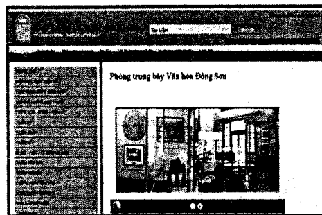
Hình 1. Bảo tàng mạng LS quốc gia

BTA còn thể hiện tính đa phương tiện và kết nối cao trong việc trưng bày hiện vật.