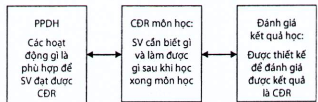
Hình 2. Mối liên hệ giữa PPDH, phương pháp đánh giá nhất quán với CĐR

biểu diễn trên sơ đồ để không làm rối sơ đồ. Chẳng hạn, giữa PPDH (hoạt động dạy và học) với đánh giá kết quả ĐT/học tập có mối liên hệ sau (hình 2):