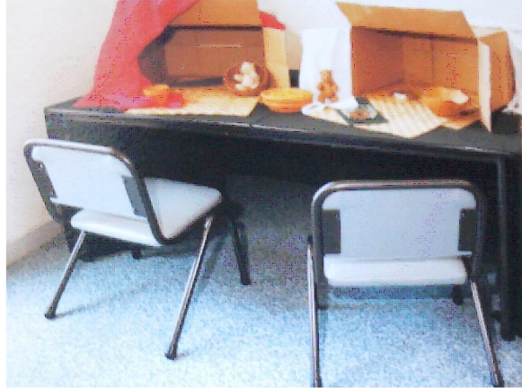
Hình 2. Tạo ra khu vực chơi xác định trước số lượng người chơi

- Tạo ra khu vực chơi với việc xác định trước số lượng trẻ chơi, ví dụ kê 2 cái ghế trước một cái bàn hoặc đặt một tấm thảm vuông sao cho chỉ đủ 2 trẻ ngồi chơi ở đó.