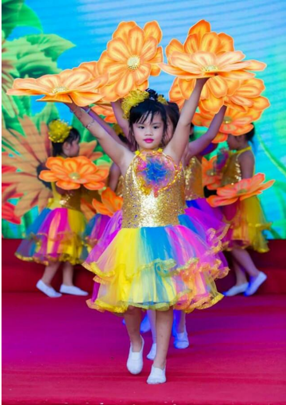
Các cháu Trường mầm non 8/3 - Nha Trang biểu diễn múa (ảnh tư liệu)