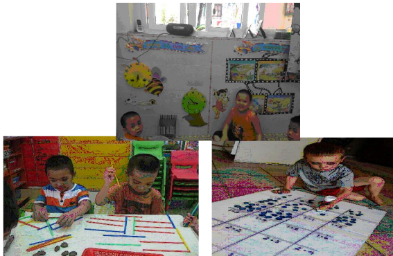
Hình 3, 4, 5

Trong GHT luôn chú ý đến tranh khái niệm, các hoạt động cá nhân trẻ và các hoạt động nhóm nhỏ và được xếp đặt với những vị trí khác nhau tận dụng không gian trong góc và thuận lợi cho việc thực hiện các nhiệm vụ của trò chơi: có những trò chơi trẻ chơi với mảng tường, có những bài tập trẻ thực hiện trên bàn, có những trò chơi trẻ có thể chơi dưới sàn lớp (xem hình 3, 4, 5).