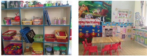
Hình 1, 2

đồ chơi được đặt ở các ngăn tủ với kí hiệu ra sao? Cần xây dựng nội quy trong góc và tất cả đều tuân theo nội quy riêng của góc (xem hình 1, 2).