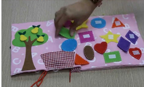
- Trò chơi phán đoán tìm những vật giống nhau...