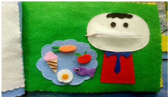
- Trò chơi với hoa, quả củ (dán, phân loại, đếm... các loại hoa quả...)