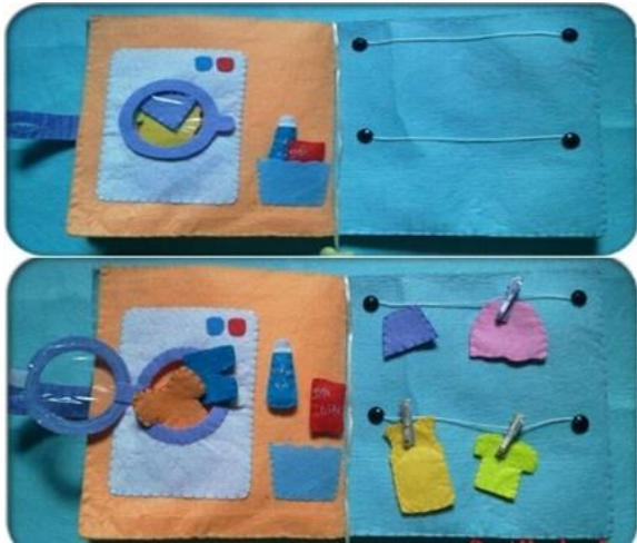
- Trò chơi với các hình (phân biệt, dán tương ứng, ghép hình...)