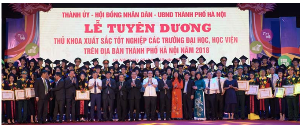
Hình 3. Lễ tuyên dương các thủ khoa xuất sắc tại Văn Miếu