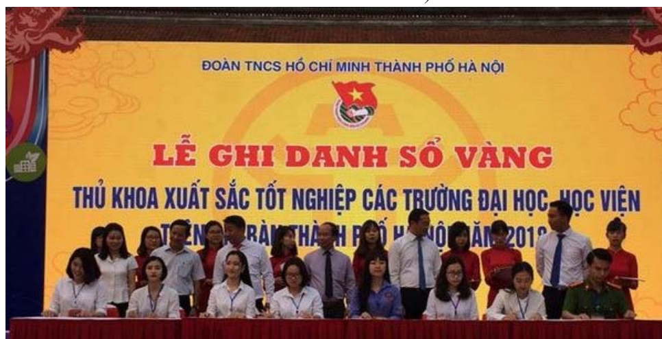
Hình 4. Lễ ghi danh sổ vàng tại Văn Miếu - Quốc Tử Giám