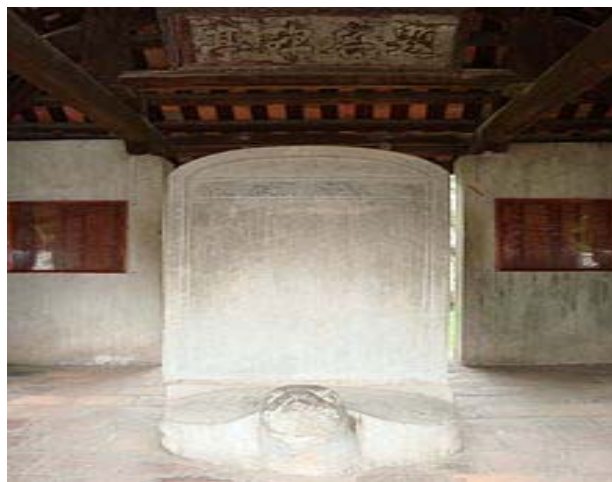
Hình 2. Bia Tiến sĩ khoa thi năm 1442 (Bia Tiến sĩ đầu tiên của Việt Nam)

- GV nêu vấn đề: “Hầu hết các thí sinh đến Văn Miếu... sờ đầu rùa đều ở những vùng miền khác nhau với những gương mặt... hóm hờ khác nhau khi đã được sờ vào