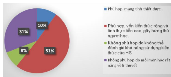
Hình 1. Kết quả khảo sát đánh giá về DHTH

Hình 1 cho thấy, DHTH là phù hợp, vốn kiến thức rộng và tính thực tiễn cao, gây hứng thú người học (51%); không nhiều SV cho là không phù hợp do không thể đánh giá khả năng sử dụng kiến thức của