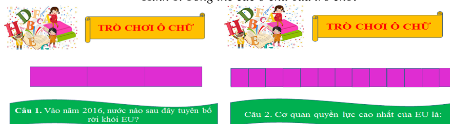
Hình 2. Ô chữ và câu hỏi gợi ý